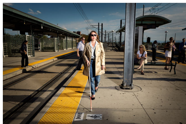
Foto 2. Vaegnägijaga on arvestatud perrooni kavandamisel

( http://commons.wikimedia.org/wiki/File:Lviv_train_station_inside.jpg )