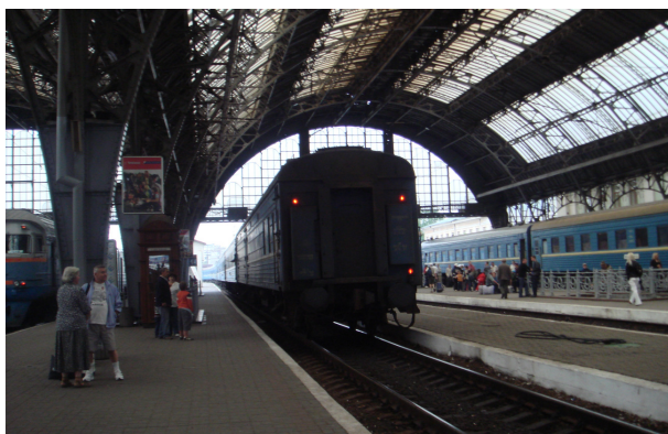
Foto 1. Vaegnägijaga ei ole arvestatud perrooni kavandamisel

( http://commons.wikimedia.org/wiki/File:Lviv_train_station_inside.jpg )